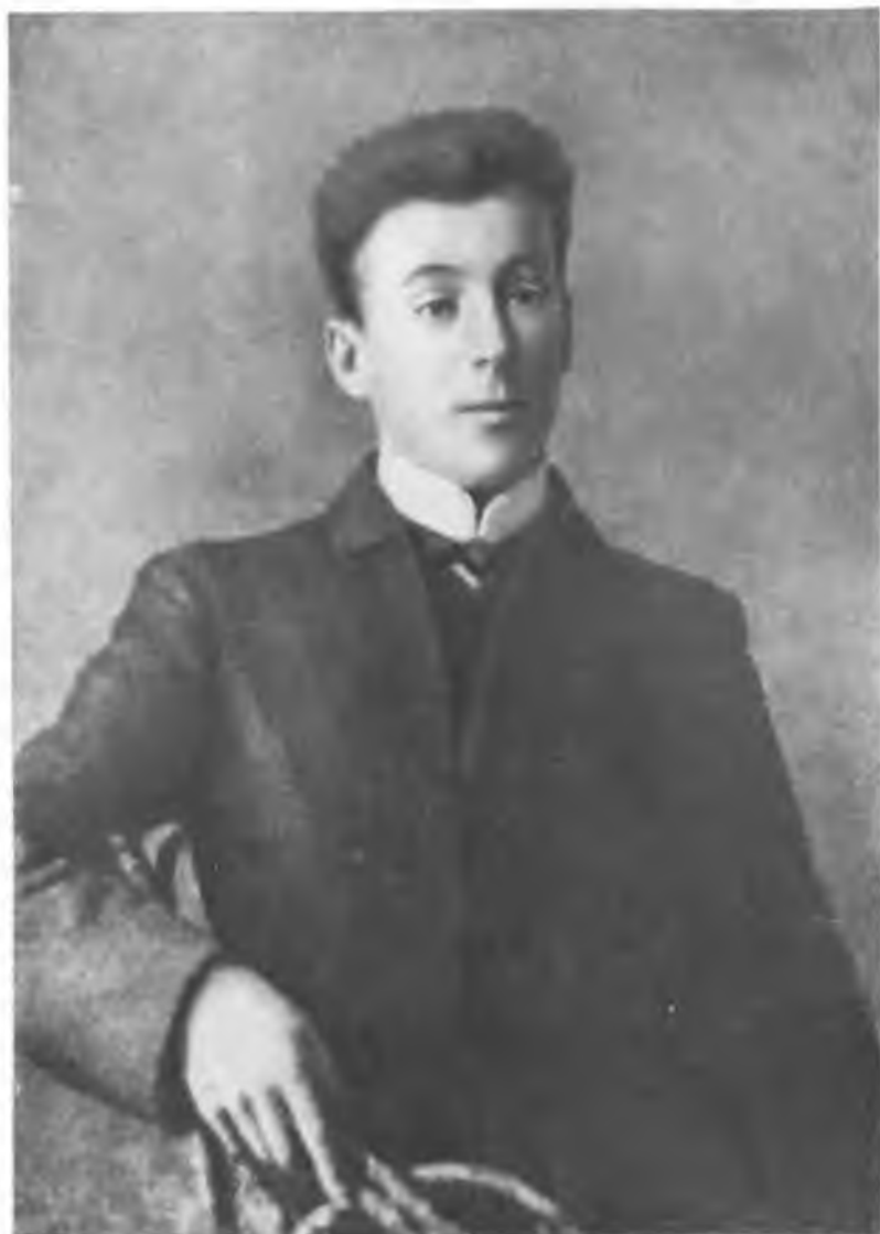
Вадим Подбельский после возвращения из эмиграции 1907 г.