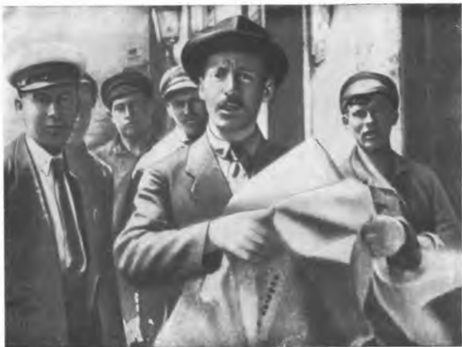
В. Н. Подбельский среди красноармейцев. 1919 г.