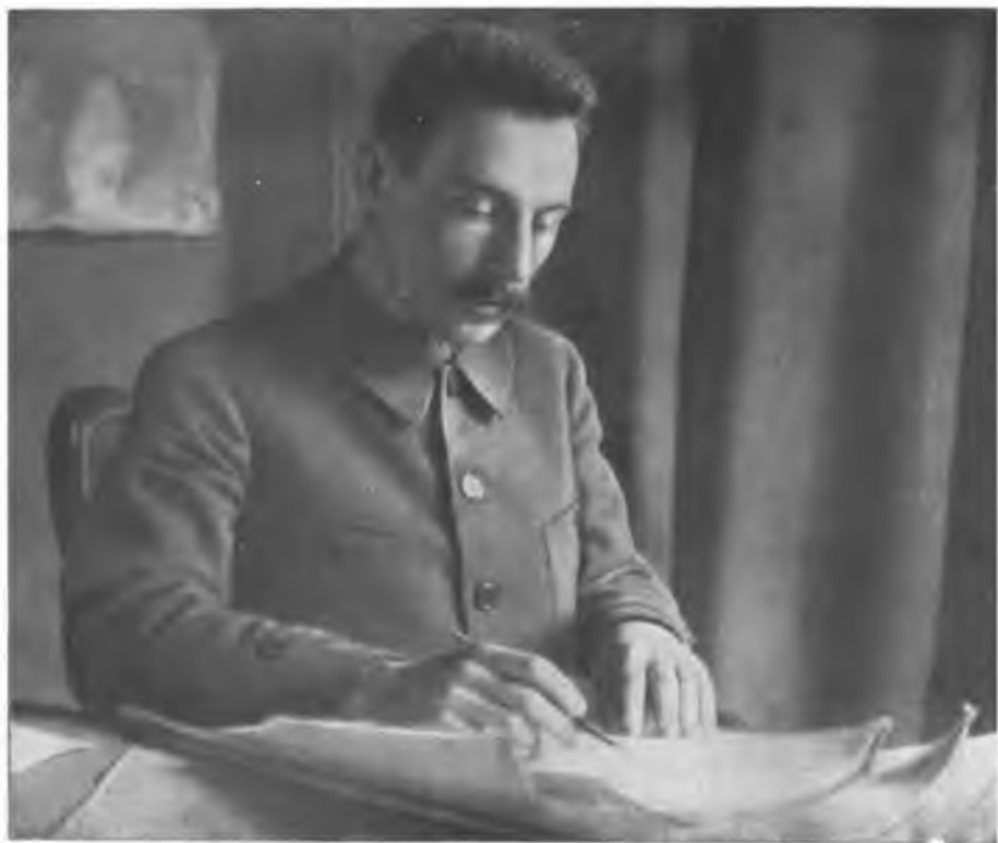
В. Н. Подбельский — Народный комиссар почт и телеграфов РСФСР. 1919 г.